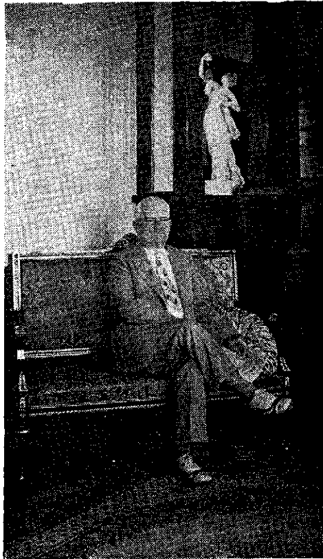
Senador VERNON RICHARDSON, invitado de honor al Congreso de Bolívar y representante ante él del Estado de Kentucky.